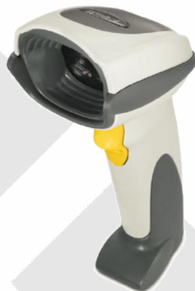
Motorola Symbol DS6707 Digital Imager Scanner

Die betreffenden Sendungen sind schon bereits in CodX PostOffice erfasst und werden anschliessend mit dem Scanner aufgerufen. Dies wird mittels des UPOC's oder Alternativ-Codes gemacht. Im ersten Schritt werden die bisher erfassten Bilder angezeigt und Sie können auch weitere Bilder hinzufügen, auch wieder mittels des Handscanners.